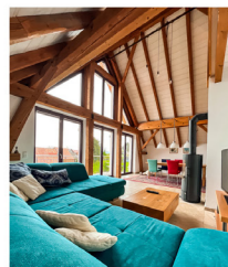
Ferienwohnungen für 2–8 Personen

Urlaub, Veranstaltungen & Kultur Tel.: +49 (0)7641 9571 499 kontakt@im-storchenhof.de