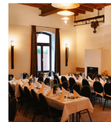
Veranstaltungsraum Seminare, Feiern